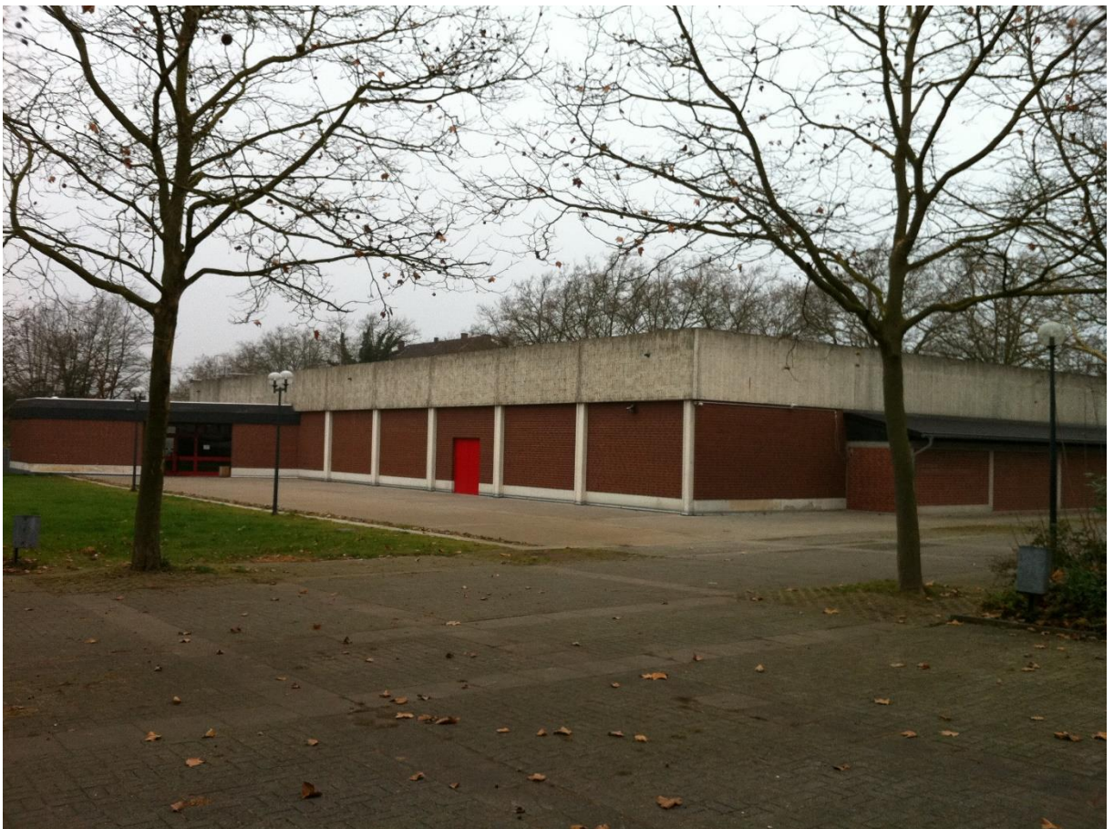
Turnhalle am Billerbeck