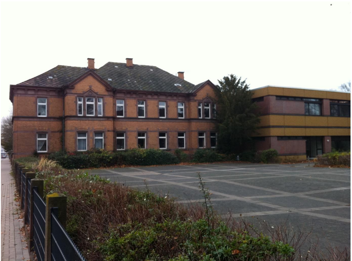
Bendal mit oberem Schulhof in der Wilhelmstraße