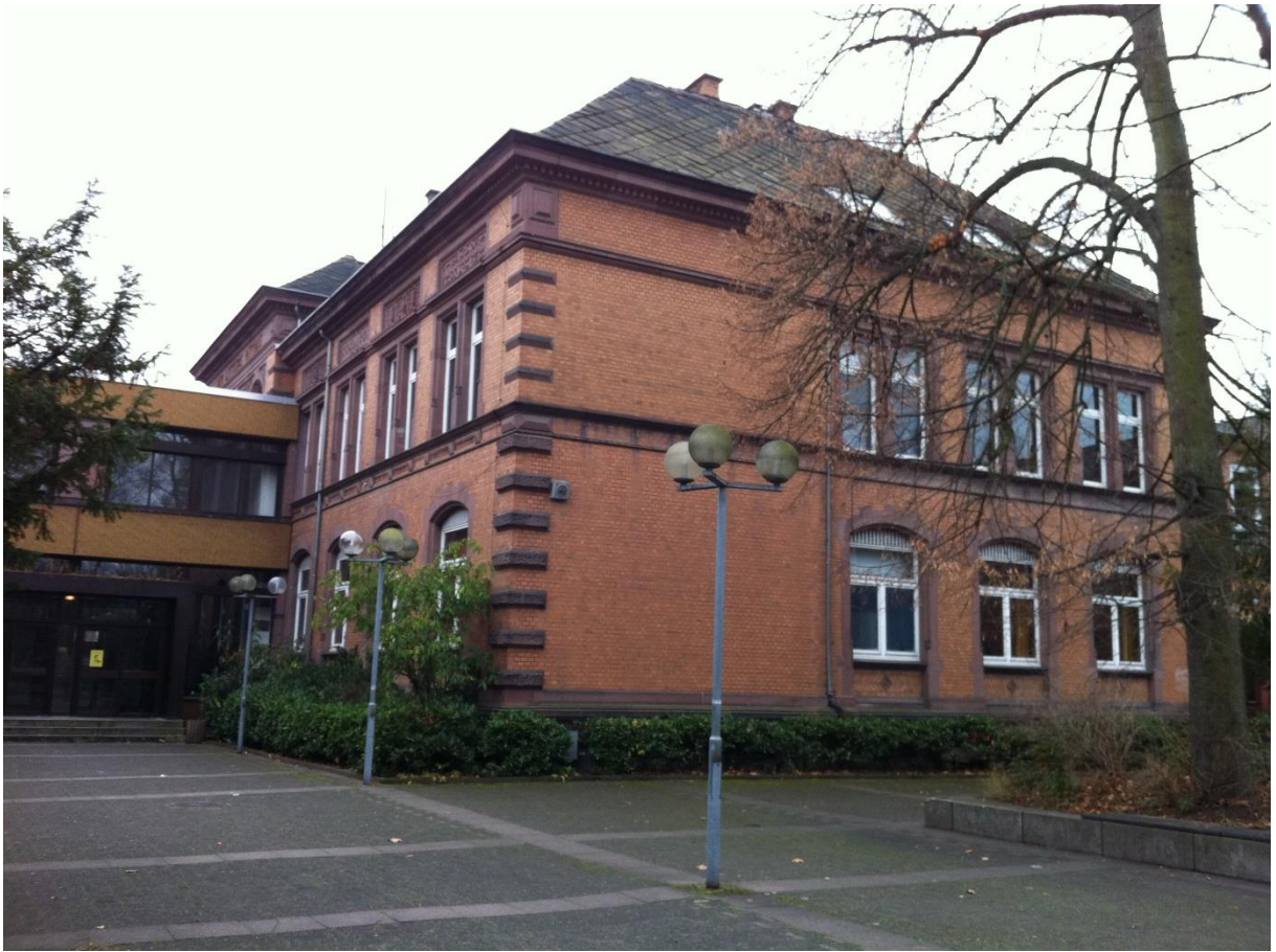
Remtergebäude am Billerbeck