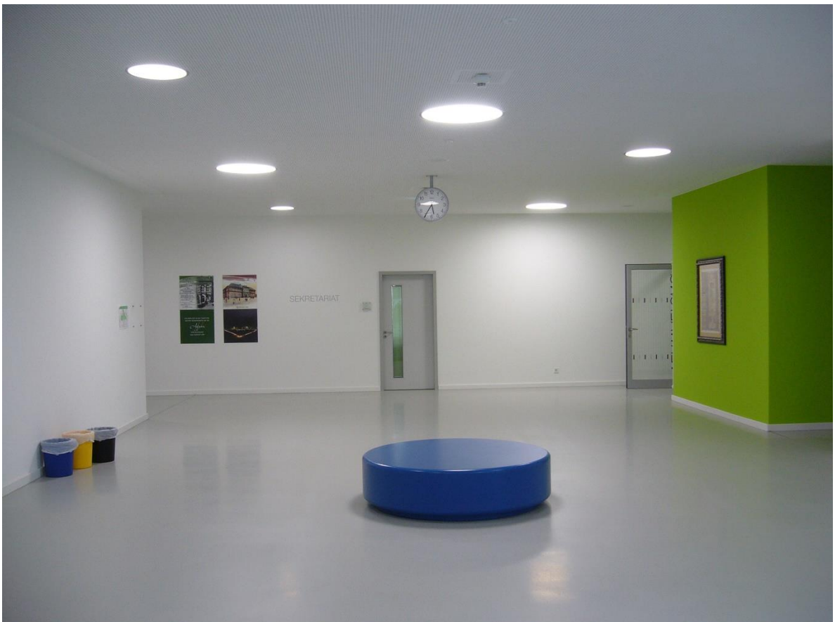
Flur im Klassenraumtrakt