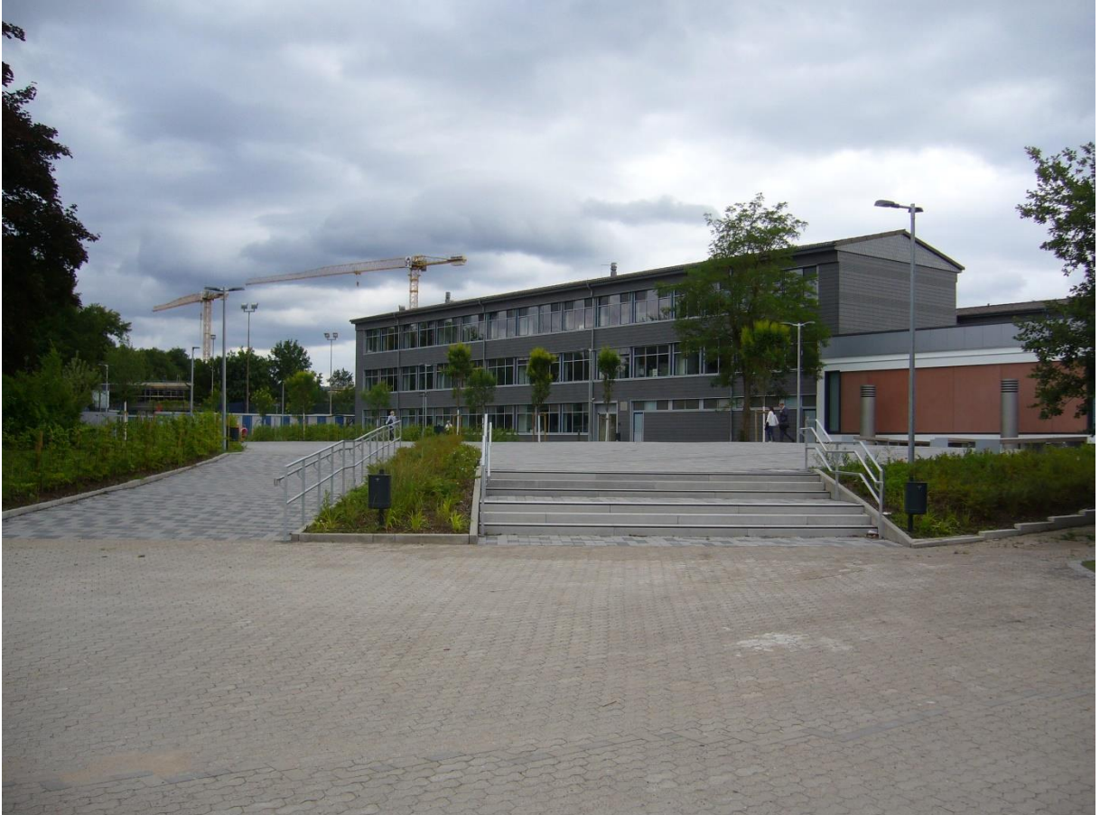
Blick vom Schulhof auf naturwissenschaftlichen Trakt