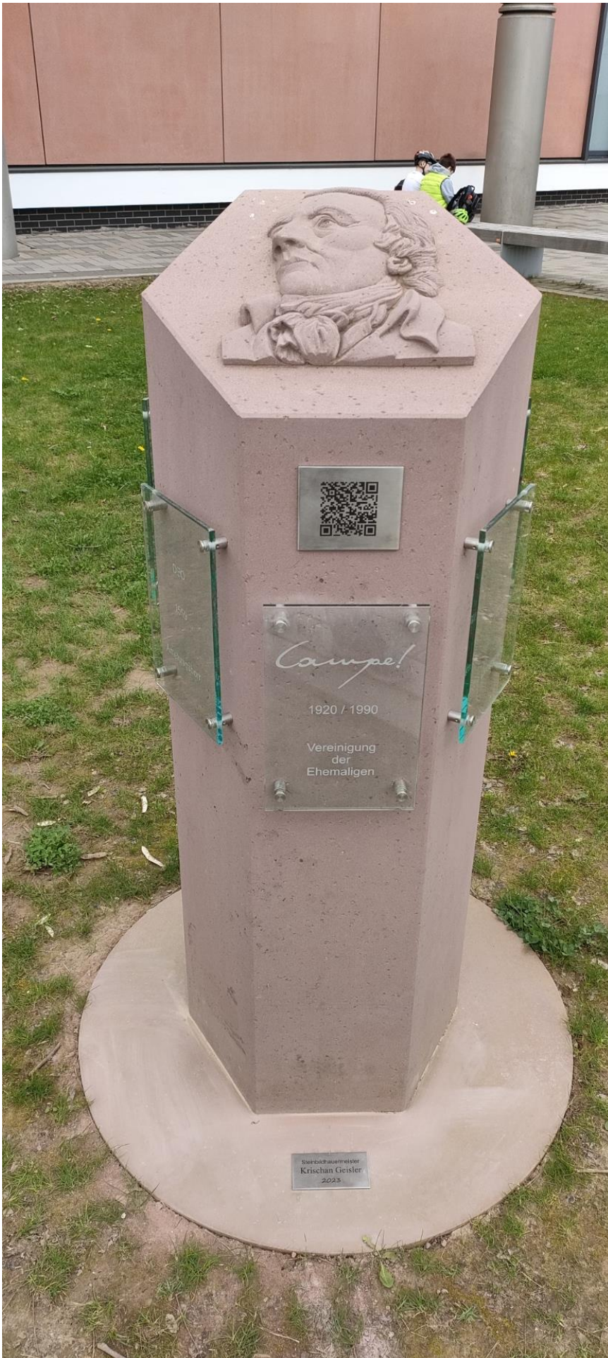
Der „Ursprung“ – Joachim Heinrich Campe Gedenkstele