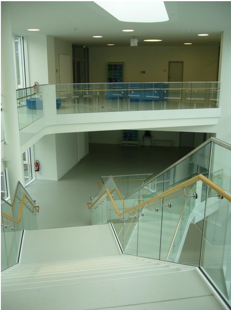
Blick von Zentraltreppe