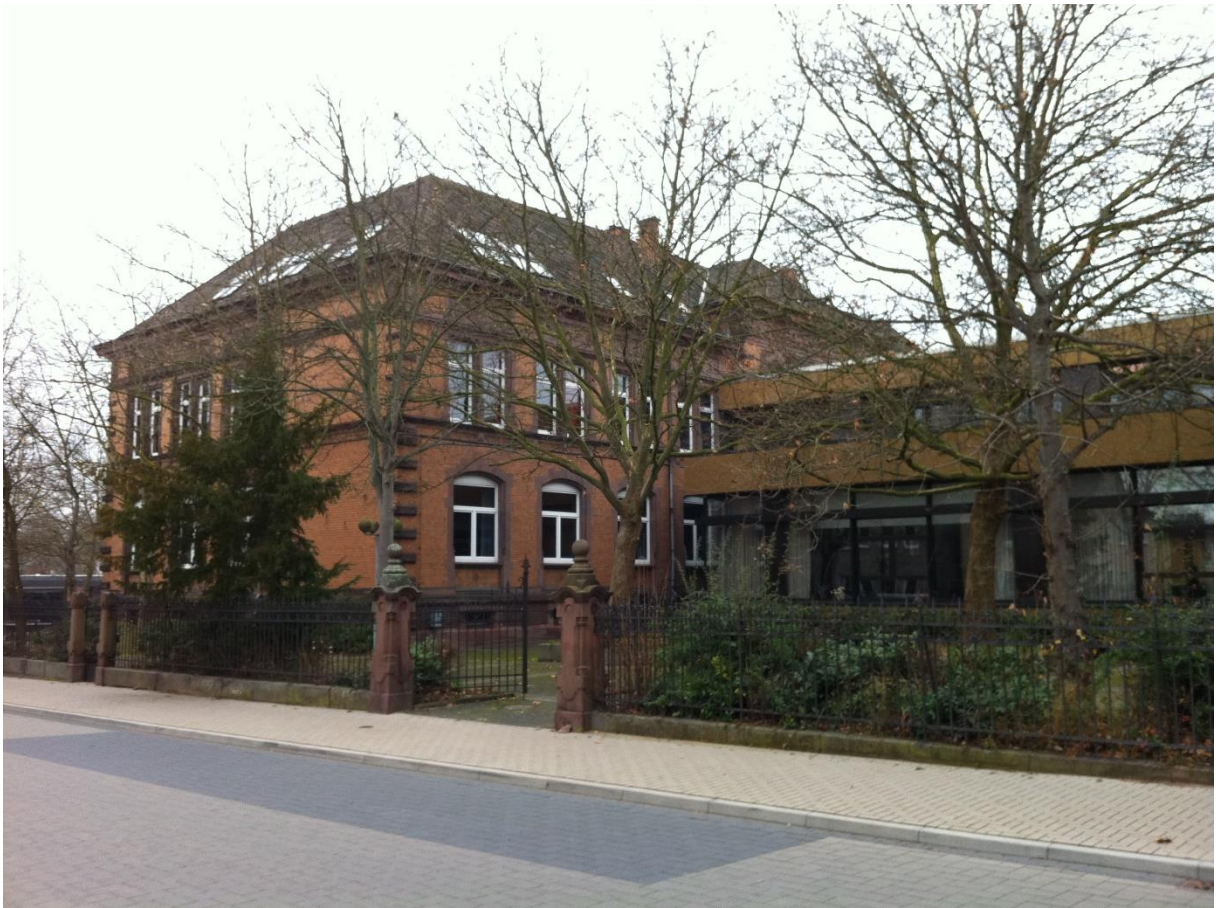
Remtergebäude und Anbau zwischen Remter und Bendal von der Wilhelmstraße aus