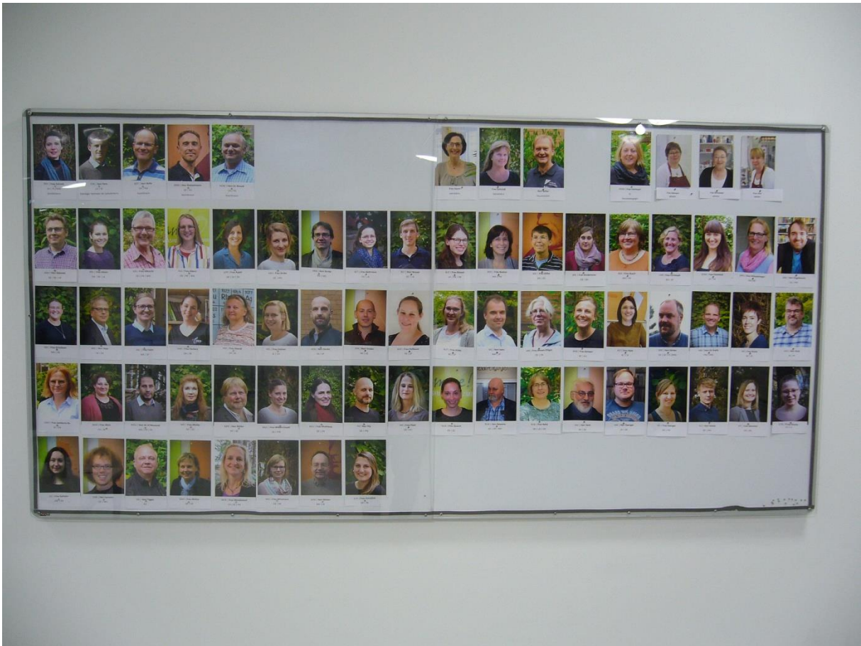
Die unverzichtbaren Wissensvermittler