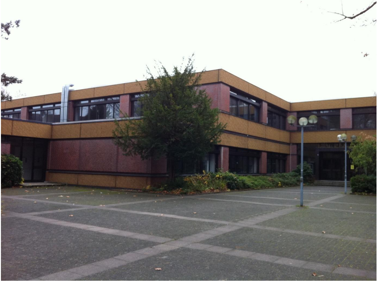
Anbau von 1976 am Billerbeck