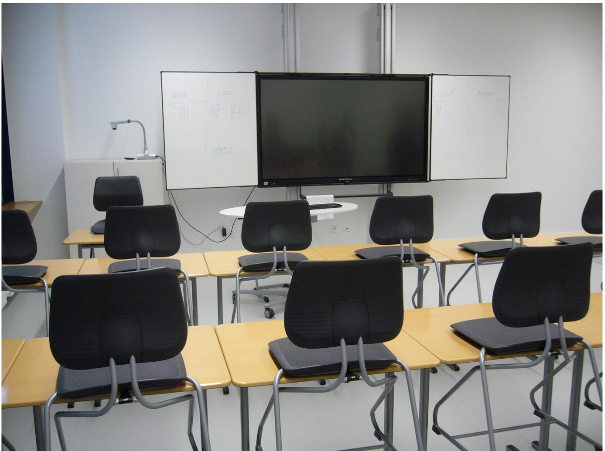
Klassenzimmer mit digitalen Tafeln