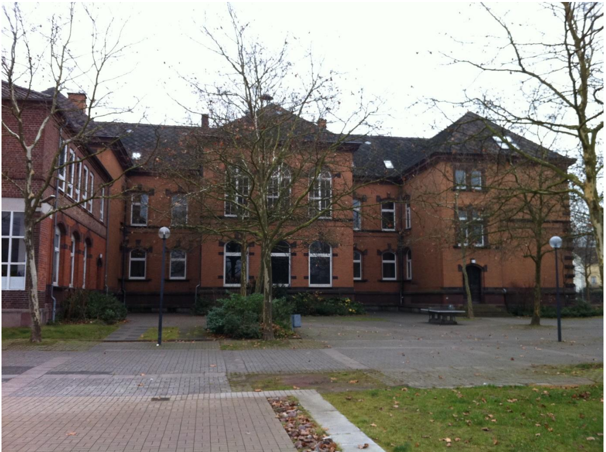
Remtergebäude mit Schulhof an der Wilhelmstraße