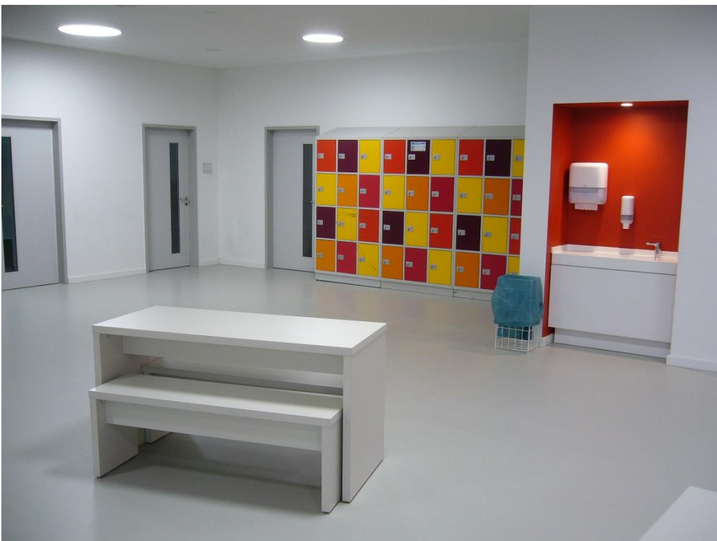
Flur im Klassenraumtrakt