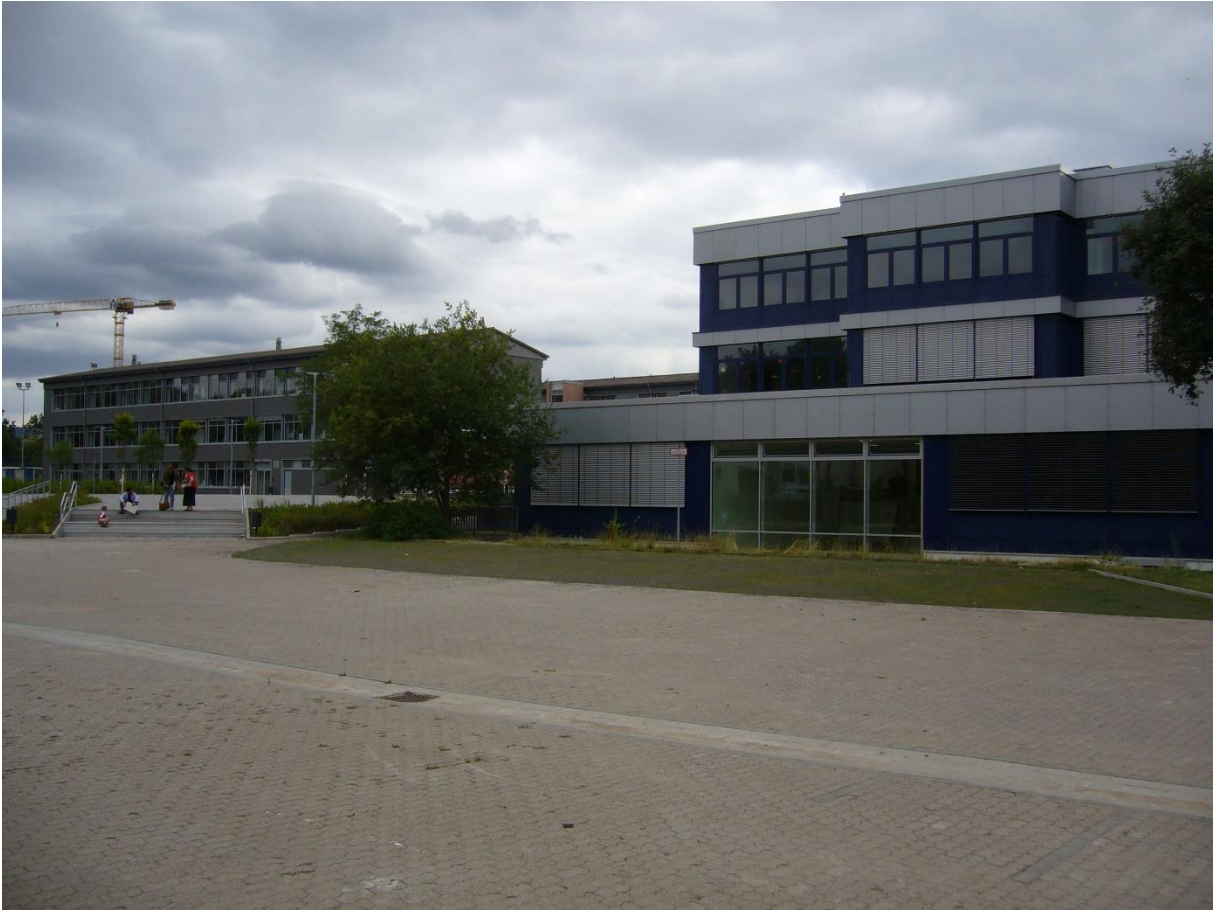
Blick vom Schulhof auf Haupt- und Nebengebäude