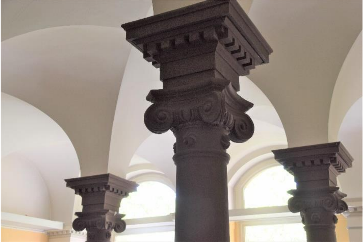
Kreuzgratgewölbe im Remter