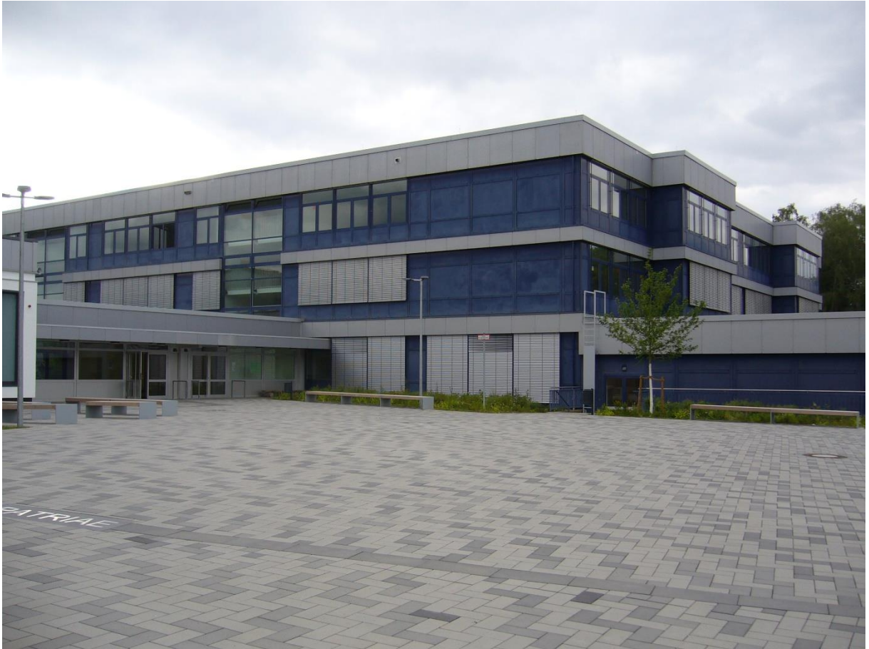
Eingang zum Hauptgebäude