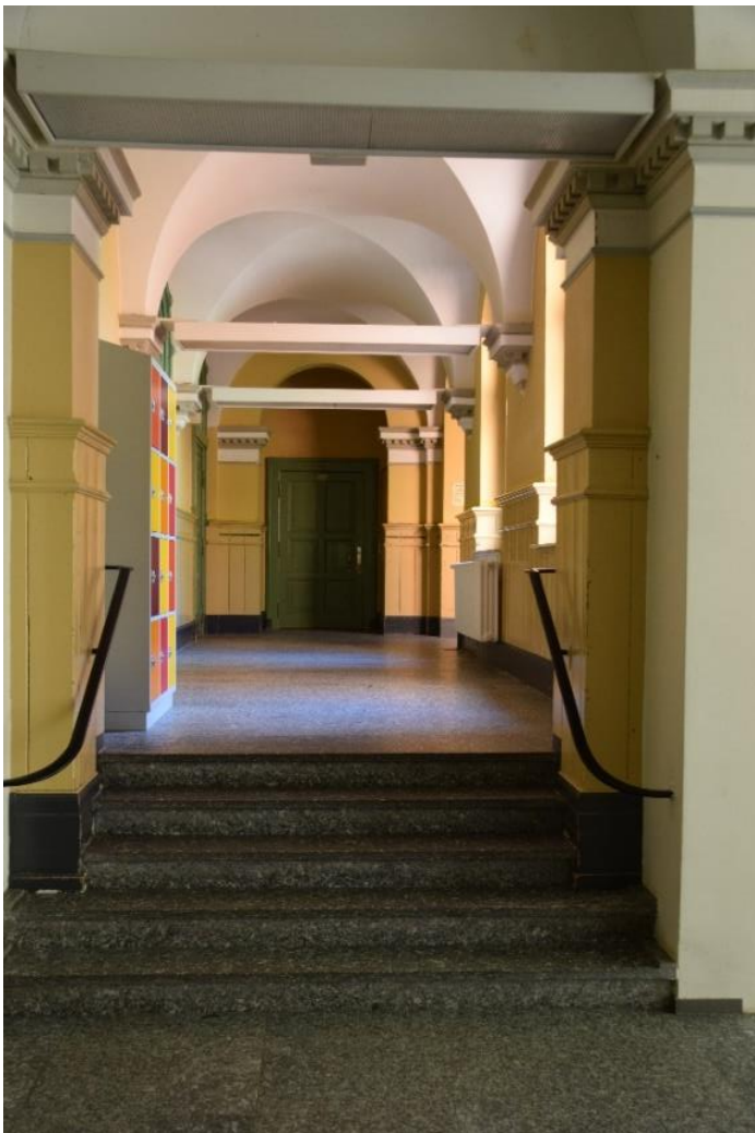
Weitestgehend originaler Flur im Remter